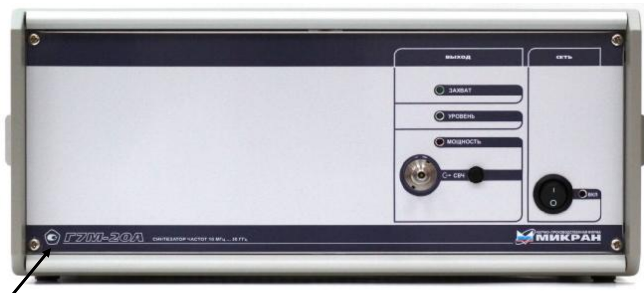
Место нанесения знака утверждения типа